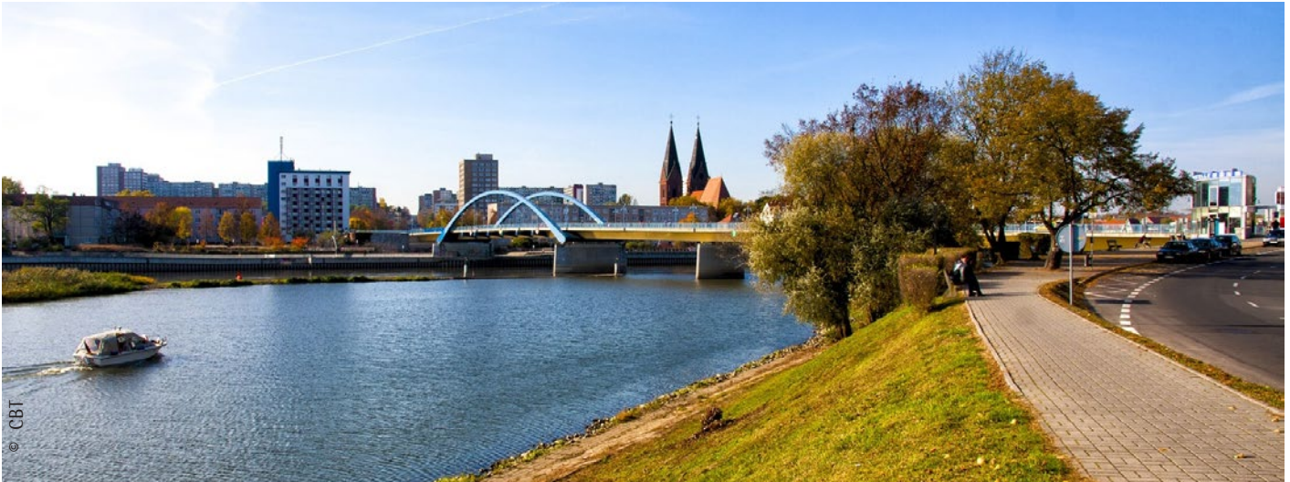
Die Brücke über die Oder verbindet Deutschland und Polen und steht sinnbildlich für die Christlichen Begegnungstage

Entstanden sind die Christlichen Begegnungstage (CBT) 1991 in Görlitz auf Einladung der Evangelischen Kirche der schlesischen Oberlausitz an die Partnerkirchen in Polen und der damaligen Tschechoslowakei. Seit dem Jahr 2005 beteiligen sich auch die evangelischen Kirchen in der Slowakei, in Ungarn und Österreich, sowie die bayerische und sächsische Landeskirche. Im Laufe der Zeit haben sie die Begegnungstage zu einem Christentreffen der evangelischen Kirchen aus ganz Mittel- und Osteuropa entwickelt.