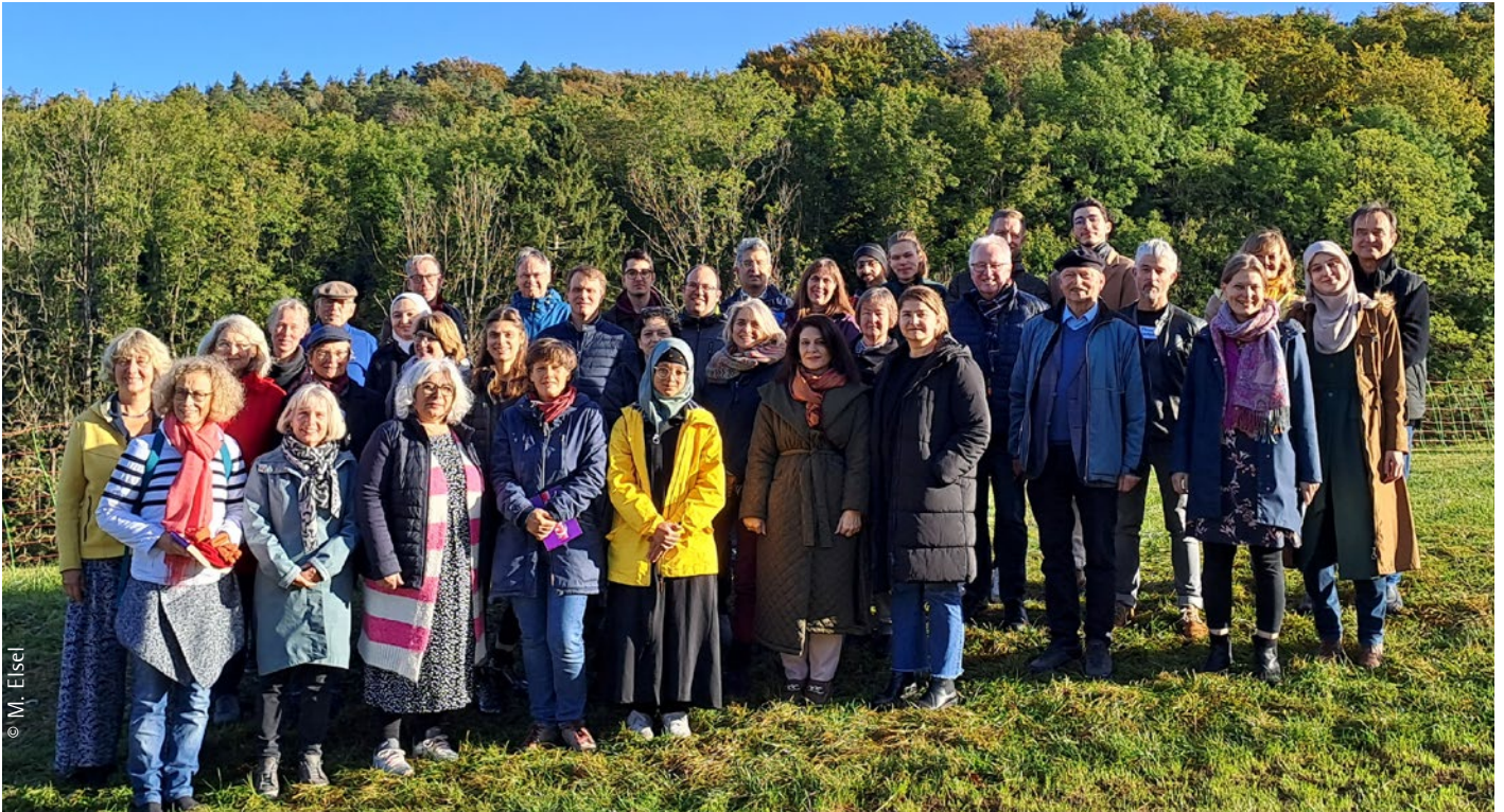
Teilnehmende an der Veranstaltung „Interreligiöses Netzwerk Klimagerechtigkeit“, 20.-22. Oktober 2023 in Bad Staffelstein

Die Religionen lehren uns, für die Erde und füreinander zu sorgen. Doch die Welt ist völlig aus dem Gleichgewicht geraten. Was sich da verändert betrifft uns alle. Daher haben sich Menschen aus Religionsgemeinschaften, Umweltverbänden und zivilgesellschaftlichen Organisationen in Bayern zusammengetan, um ein interreligiöses Netzwerk für Klimagerechtigkeit aufzubauen. Den Auftakt gab eine Werkstatttagung, zu der Teilnehmende mit unterschiedlichen religiösen Hintergründen zusammenkamen.