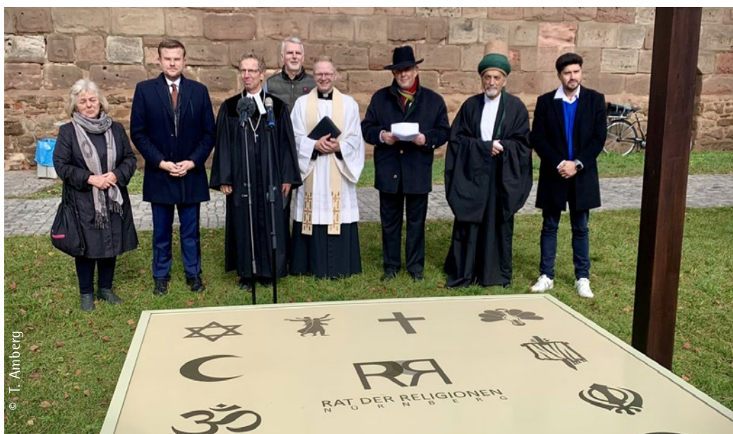
Beteiligte des Friedensgebetes des Rates der Religionen Nürnberg am 25.10.2023 vor dem Gedenk-Kubus an der Frauentormauer

rene Angriffe und Ausgrenzung von muslimischen und jüdischen Menschen hoch emotional. Sie hat auch offengelegt, wo in der Vergangenheit strittige und schwierige Themen vermieden und nicht ehrlich diskutiert wurden. Das betrifft in besonderer Weise den israelisch-palästinensischen Konflikt, aber auch den nie aufgegebenen Wunsch christlicher und jüdischer Dialogpartner nach einer Einordnung in „gute und problematische“ muslimische Akteure und Fragen der Deutungshoheit, wie religiöse Vielfalt gestaltet werden kann. Kontroverse Positionen und sich daraus ergebende Konflikte wurden auch innerhalb der ELKB zu wenig diskutiert.