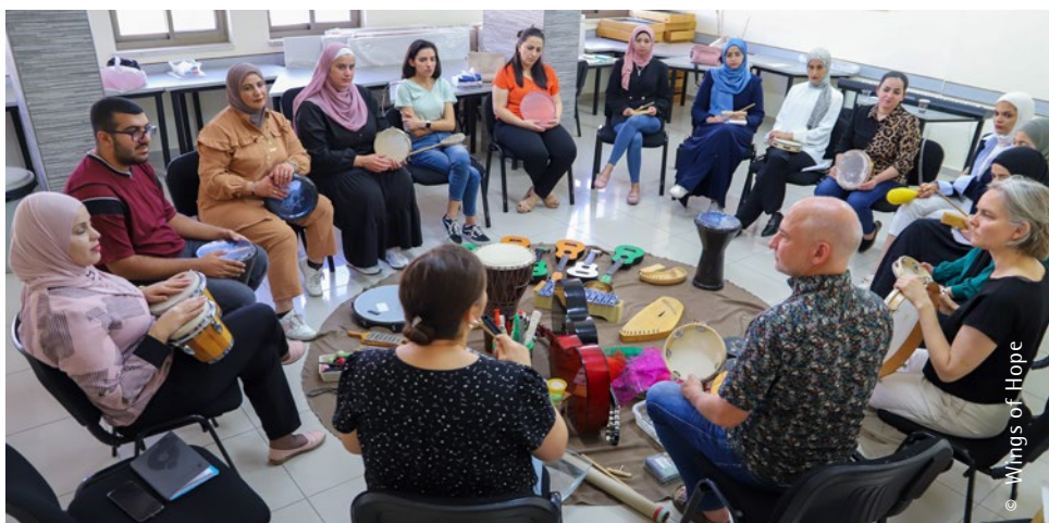
Teilnehmende der Fortbildung in Psychotraumatologie in Bethlehem, 2023

Im Traumahilfezentrum von „Wings of Hope for Trauma“ in Bethlehem führen wir unsere Arbeit unter diesen schwierigen Umständen durch. Das Traumahilfezentrum wurde im Jahr 2011 in Bethlehem gegründet und ist seitdem eine Anlaufstelle für Menschen, die Gewalt erlebt haben und erleben und Unterstützung brauchen. Unsere Arbeit der letzten Monate ist auch ein Kampf gegen Hoffnungslosigkeit und Ohnmacht, die wir im Land und bei den Menschen, die