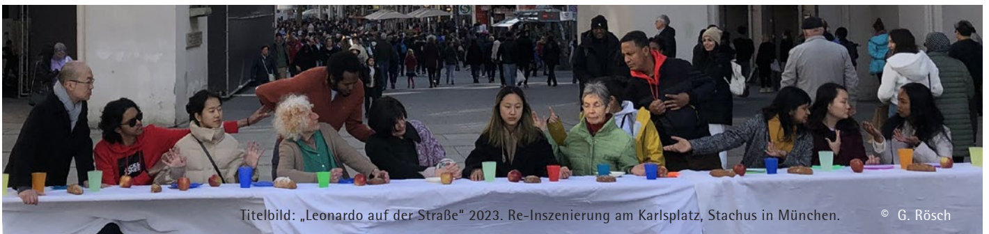
Titelbild: „Leonardo auf der Straße“ 2023. Re-Inszenierung am Karlsplatz, Stachus in München.

27 Ansprechpartner*innen im Ökumenereferat