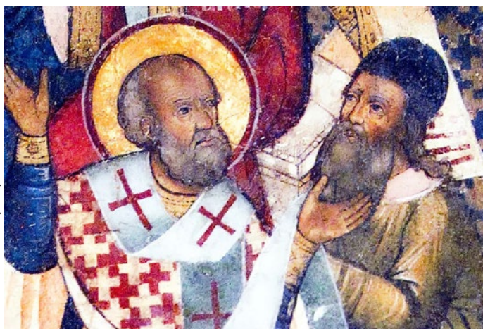
Nikolaus von Myra ohrfeigt Arius auf dem ersten Konzil von Nizäa: Griechisch-Orthodoxe Ikone aus dem Mittelalter (Ausschnitt).

Wie der theologische Streit außer durch Debatten und Wortgefechte auch geführt wurde, illustriert eine Darstellung, die zeigt, wie Bischof Nikolaus (ja: der Nikolaus) einen Opponenten, den Priester Arius, beim Konzil ohrfeigt.