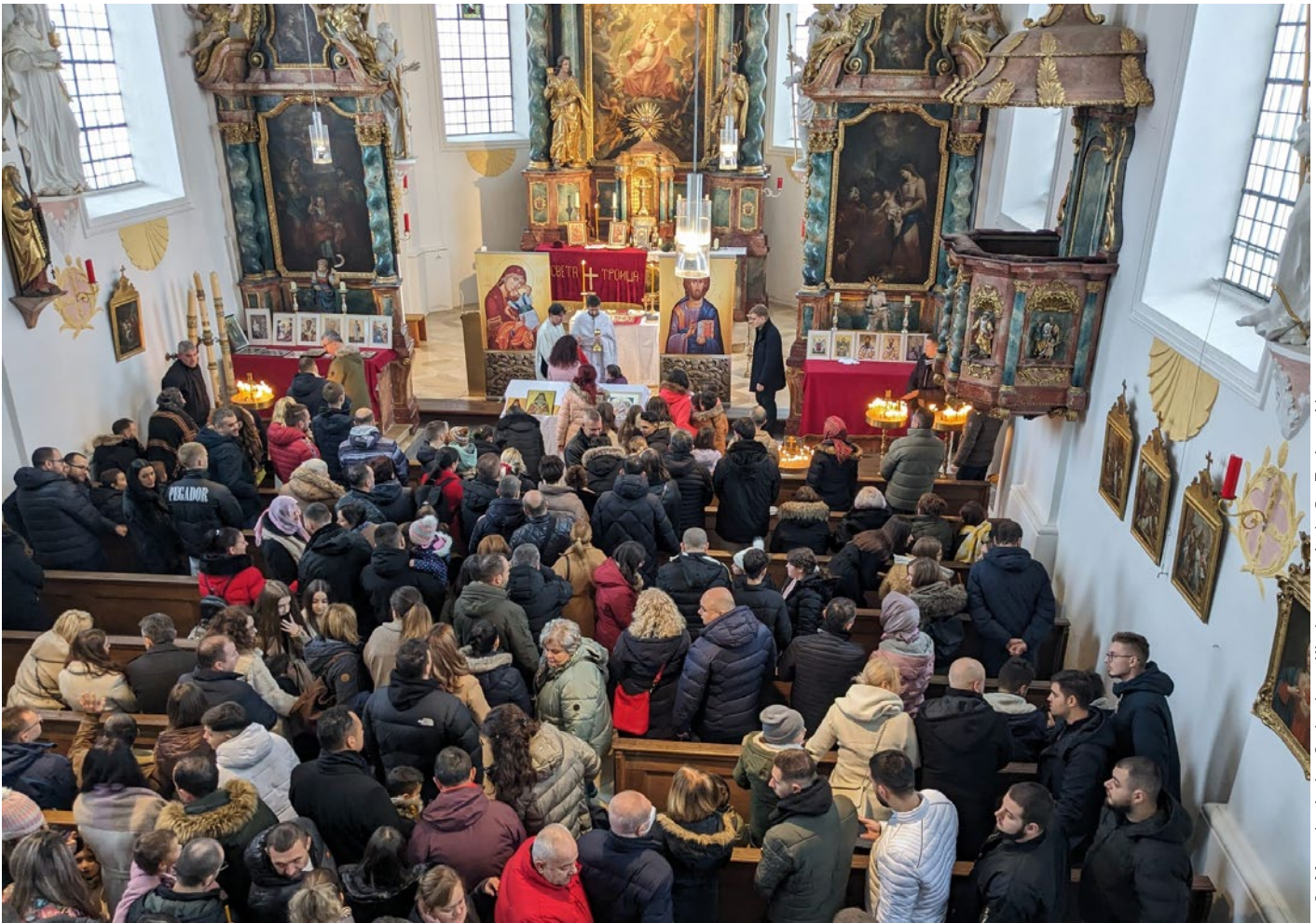
© Mazedonische Orthodoxe Kirchengemeinde Sv. Troica e.V.