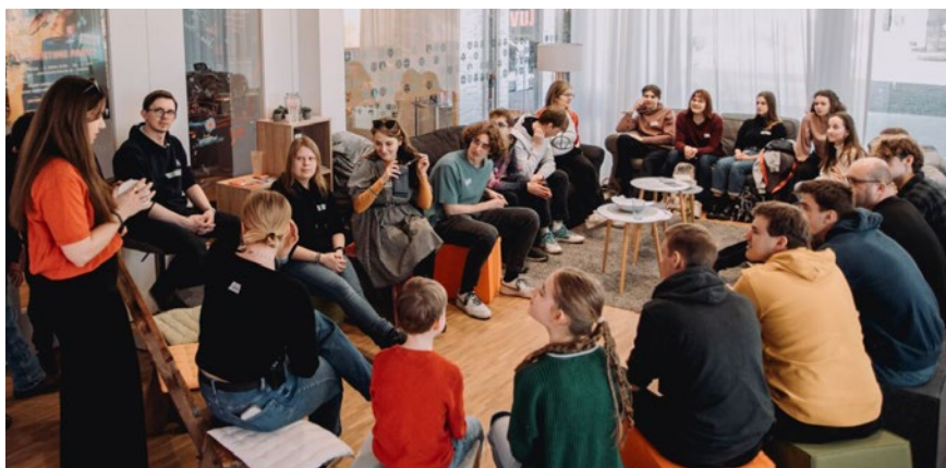
Jugendliche aus Bayern und der Slowakei bei der Eröffnung der Fastenaktion in Lindau